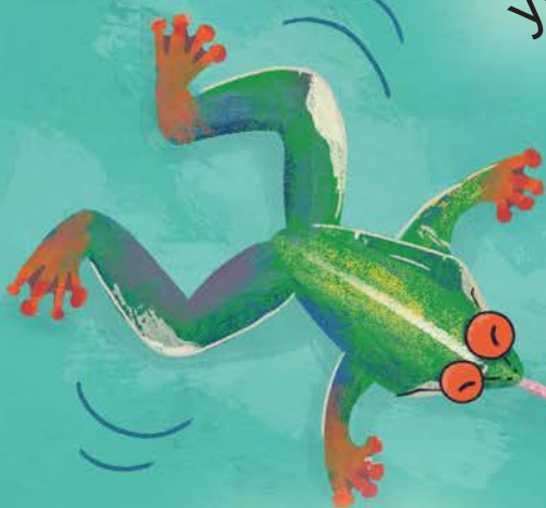
Lidah yang lengket