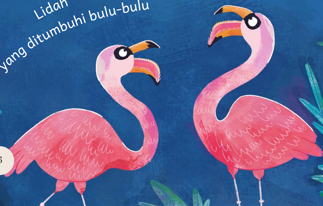
Lidah yang ditumbuhi bulu-bulu